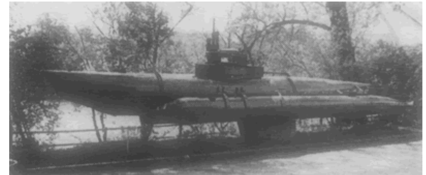
Kleinst-U-Boot Biber - ein Mann und zwei Torpedos.